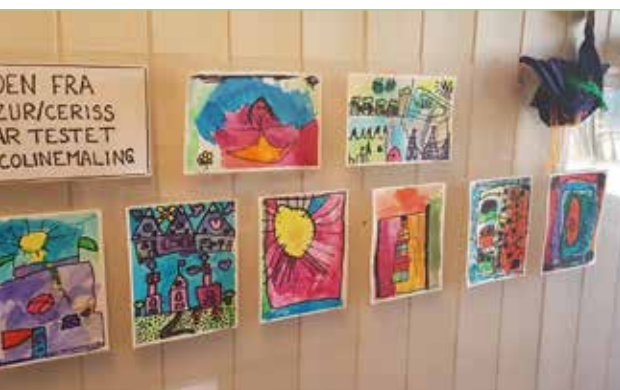
'De talende vægge' – som i et akvarium – viser hvad børnene for tiden er optaget af, med deres eget udtryk.

Grundlæggende var vi meget inspirerede af Malaguzzi og Reggio Emilia med deres tanker om rummet som den tredje pædagog. Som Malaguzzi siger det: "Miljøet skal virke som en slags akvarium, der reflekterer ideer, etik, indstillinger, opfattelser og kultur hos de mennesker, der lever i det."